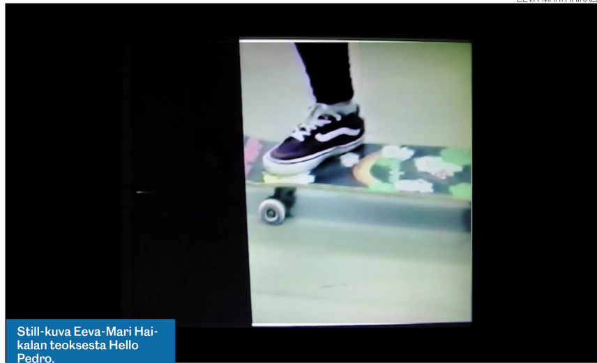
Still-kuva Eeva-Mari Haikalan teoksesta Hello Pedro.