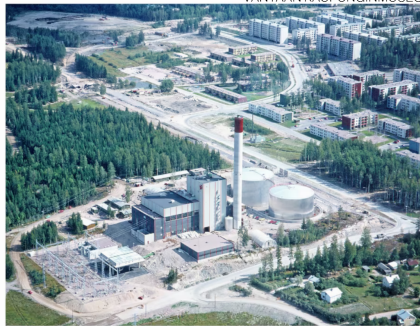
Kaakkoon päin kuvattu ilmakeku Martinlaakson voimalaitoksesta valmistumisvuonna 1975. Voimalan piippu on 85 metriä korkea. Taustalla näkyy Martinlaakson lähiö.

Ilmakuvassa vuodelta 1975 näkyy vastavalmistunut voimalaitos, joka vielä alkuvuosina oli yksipiippuinen öljyvoimala. Se rakennettiin samaan aikaan valmistuneen Martinlaakson ker-